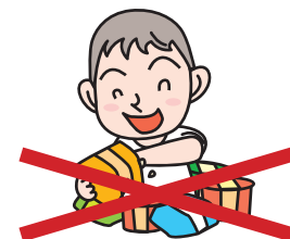
！スナック菓子は大敵！