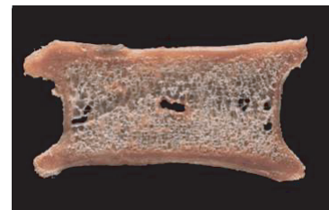
▲健康な人の骨 骨粗鬆症の人の骨▼

骨の中がぼろぼろになっておきる骨粗鬆症の原因はカルシウム不足。骨は毎日新陳代謝しています。骨を健康に保つためには、常に、その元となるカルシウムや、その吸収を助けるビタミンDを補給する必要があります。骨粗鬆症は、静かな浸透性の病気です。若い世代にきちんとカルシウムを摂取していないと、年をとって運動量も食事量も少なくなり、内臓の動きも衰えて吸収する能力が小さくなると、「寝返りうっただけで骨が折れちゃった」という状態を招いてしまうのです。若い世代の、カルシウム摂取量を極端に減らすダイエットや、吸収を妨げるリンをたくさん含むスナック菓子の食べ過ぎは、骨粗鬆症になる可能性をさらに高めています。